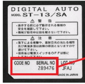
子機…リモコン裏面のラベル記載