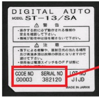
親機…リモコン裏面のラベル記載